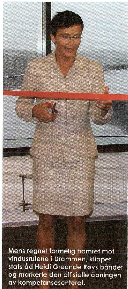
Mens regnet formelig hamret mot vindusrutene i Drammen, klippet statsråd Heidi Grande Røys båndet og markerte den offisielle åpningen av kompetansesenteret.

Hun understreket også at fri programvare er en viktig satsing i regjeringens stortingsmelding om IT-politikk; Et informasjonssamfunn for alle. Fri programvare er programvare som gir brukerne tilgang til å lese kildekoden, og rett til å endre eller videreutvikle programvaren. Dette senterets oppgaver samsvarer med regjeringens mål, sa Grande Røys. Forts. neste side